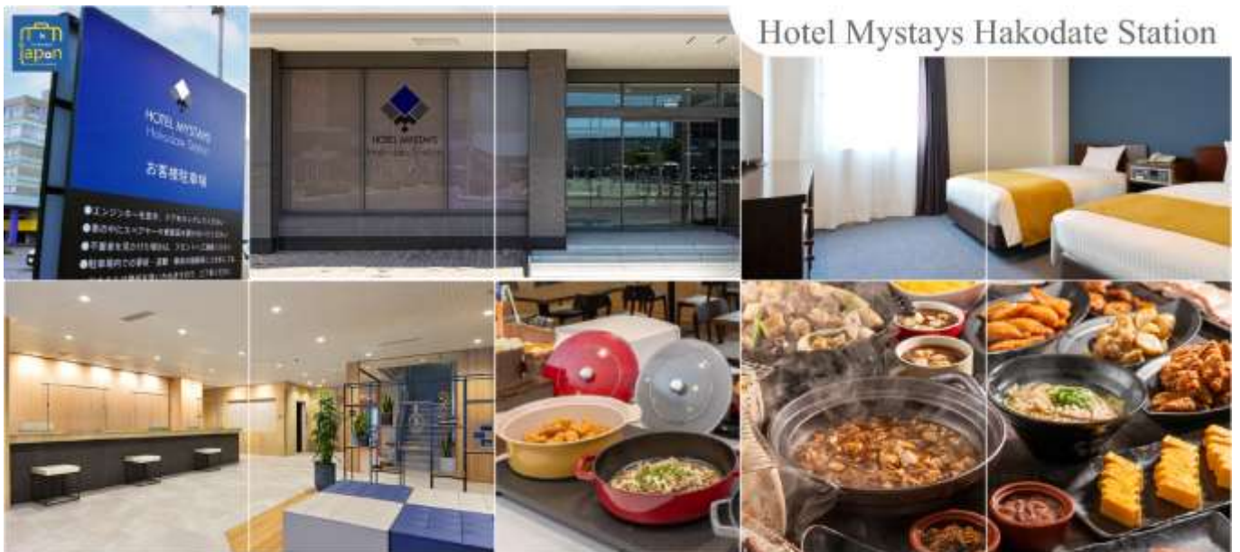
Hotel Mystays Hakodate Station

HOTEL MYSTAYS HAKODATE STATION, HAKODATE หรือเทียบเท่าระดับเดียวกัน