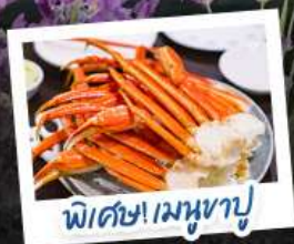
พิเศษ! เมฆงาปู