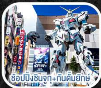
ช้อปปิ้งชินจูกุ+กันดั้มยักษ์