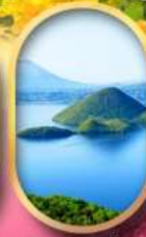
วิวทะเลสาบโทยะ