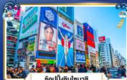
ช้อปปิ้งชินโจบาชิ