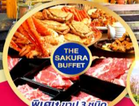
THE SAKURA BUFFET