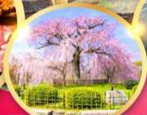
สวนสาธารณะมารุยามะ