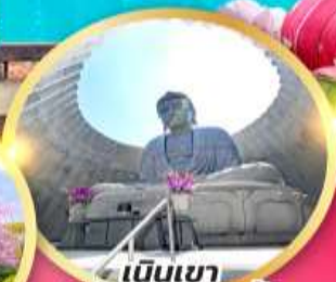
เป็นเขาแห่งพระพุทธรเจ้า