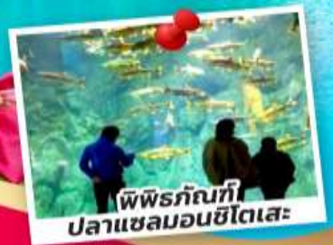
พิพิธภัณฑ์ปลาแซลมอนชิโตเสะ

ชมซากุระจุใจ ณ สวนอาซาฮิยามะ สวนสาธารณะมารุยามะ ชมหมู่บ้านเทพนิยายนิงเกิ้ลเทอรัส