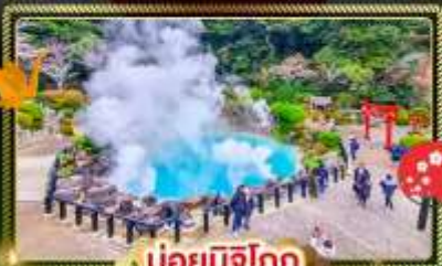
บ่อน้ำพุร้อน