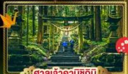
ศาลเจ้าคามิซึกิมิ