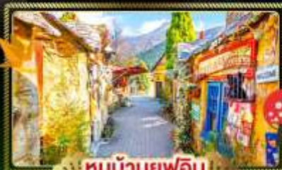
หมู่บ้านยูกูอิน