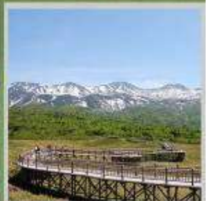
"SHIRETOKO 5 LAKES"