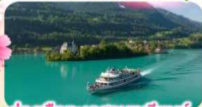
ล่องเรือทะเลสาบเบรียนซ์

พีชียอดเขาชุนเนกกา 1 ในเขาที่สวยงามที่สุดเมืองเซอร์แมก