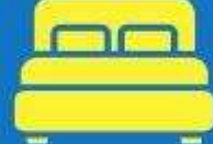
ห้องพักเตียงมืล DOUBLE