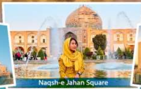
Naqsh-e Jahan Square