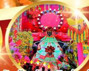
วัดเจ้าแม่กวนอิมฮองอ่า