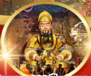
วัดเซกง 600 ปีหยุนหลอง