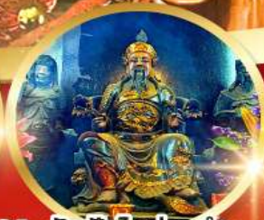
วัดปึกไคฮองอ่า