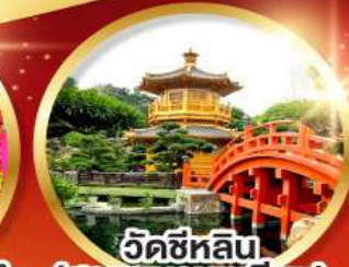
วัดซีหลิน