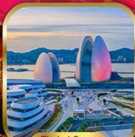
Zhaihai Opera House