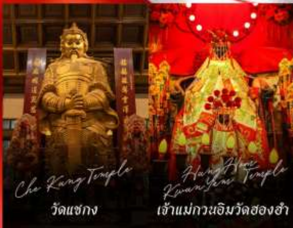
Che Kung Temple วัดแชกง

รายการทัวร์ข้างต้นอาจมีการปรับเปลี่ยนเพื่อความเหมาะสม