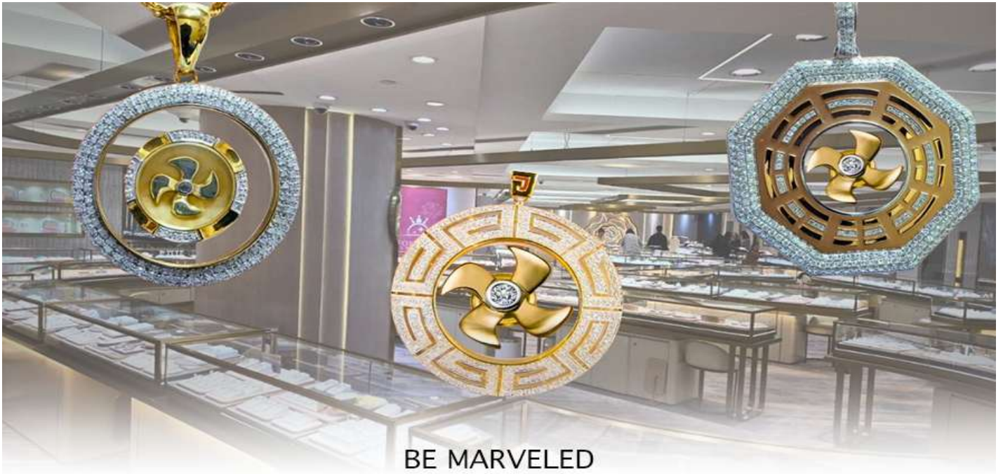
BE MARVELED ศูนย์ฮวงจุ้ย กัททันเศรษฐี

นำท่านชม ศูนย์ฮวงจุ้ย กัททันเศรษฐี ที่ขึ้นชื่อของฮ่องกง ท่านจะได้พบกับงานดีไซน์ที่ได้รับรางวัลยอดเยี่ยม และใช้ในการเสริมดวงเรื่องฮวงจุ้ย โดยการย่อใบพัดของกังหันที่เป็นสัญลักษณ์ของวัดวัดเซ่งหิมิว มาทำเป็นเครื่องประดับ ไม่ว่าจะเป็นจี้, แหวน, กำไล หรือต่างหูเพื่อเป็นเครื่องประดับติดตัว และเสริมดวงชะตา ซึ่งสินค้าทุกชนิด มีเอกสาร รับประกันคุณภาพเปลี่ยนหรือซ่อม ได้ตลอดอายุการใช้งาน หากเกิดการชำรุดจากสินค้าไม่ใช่อุบัติเหตุ