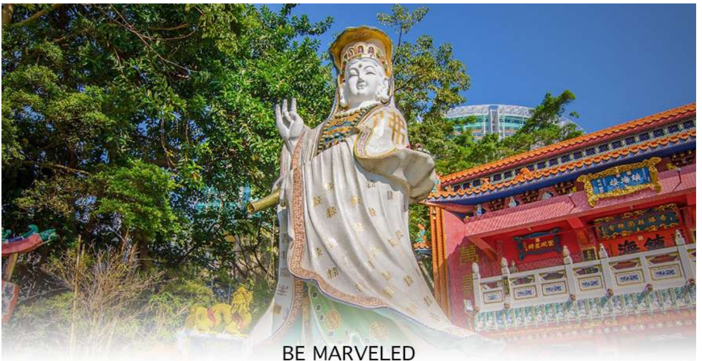
BE MARVELED วัดเจ้าแม่กวนอิมรีพลัสเบย์

จากนั้นนำท่านเดินทางสู่ ชายหาดรีพลัสเบย์ (REPULSE BAY) หาดทรายรูปจันทร์เสี้ยวแห่งนี้เป็นหาดที่สวยงามที่สุดแห่งหนึ่งในฮ่องกง และยังใช้เป็นฉากในการถ่ายทำภาพยนตร์หลายเรื่อง ถือเป็นแหล่งท่องเที่ยวยอดนิยมในหมู่ชาวฮ่องกง นักท่องเที่ยวนิยมมาสักการะที่ วัดทินฮั่ว อารีพลัสเบย์ (TIN HAU TEMPLE REPULSE BAY) ซึ่งตั้งอยู่ริมทะเล เป็นสถานที่ท่องเที่ยวสำคัญ สร้างขึ้นในปี ค.ศ.1993 มีรูปปั้นของ เจ้าแม่กวนอิม ปางประทานพรตั้งอยู่ ซึ่งคนฮ่องกงและคนจีนให้ความเคารพนับถือมากที่สุด เชื่อว่าเป็นเทพที่มีความศักดิ์มากขอพรเรื่องงานการเงิน และขอพรขอโชคลาภเพื่อเป็นสิริมงคลและขอพร