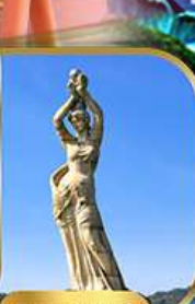
จูไห่ฟิชเชอร์เก็ส