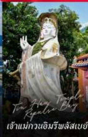
Tsim Sha Tsui Repulse Bay เจ้าแม่กวนอิมรัชลิสเบย์