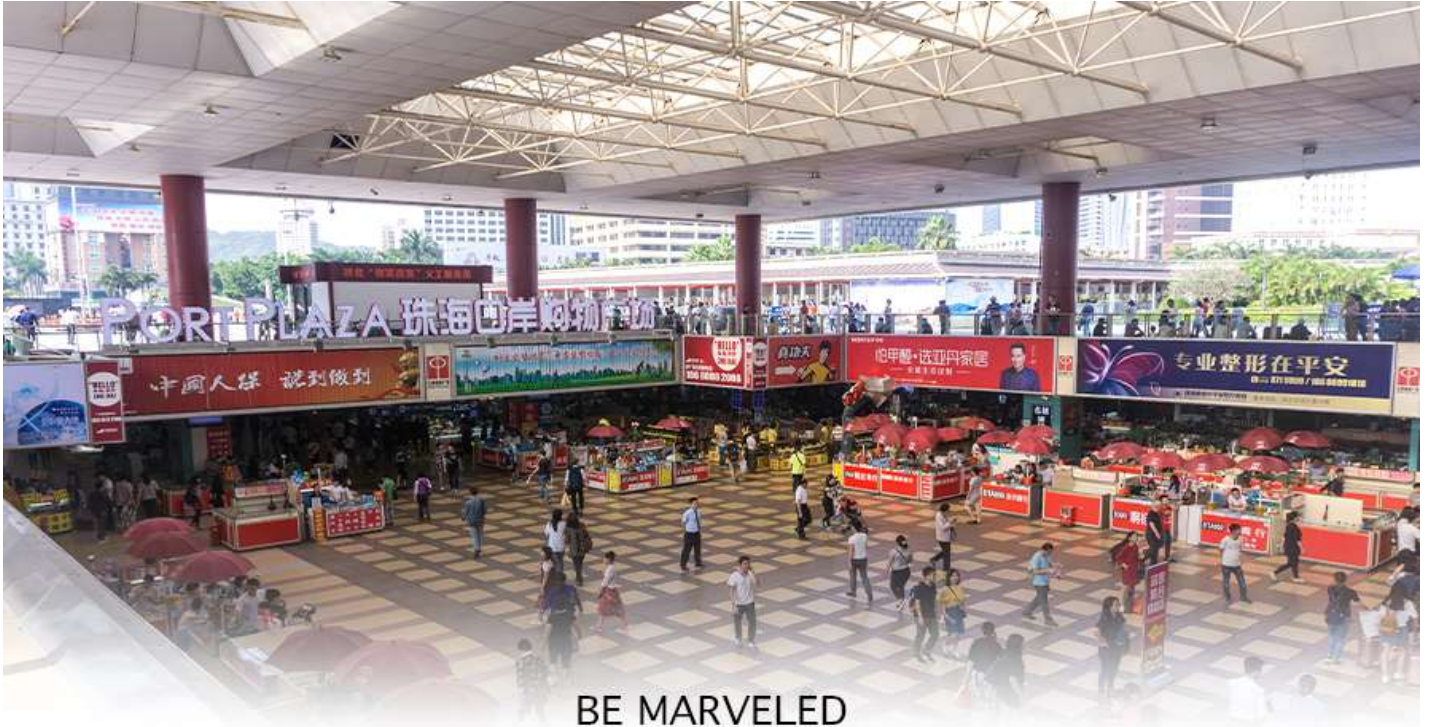
BE MARVELED ตลาดใต้ดิน กวเป่ย์

📍 อิสระอาหารอาหารเย็นตามอัธยาศัย **เพื่อความสะดวกในการซื้อปิ้ง**