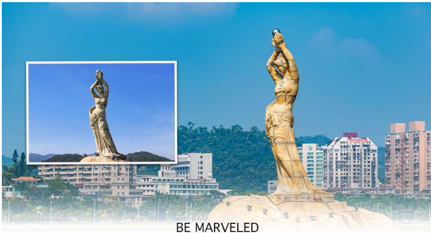
BE MARVELED จูไห่พีซเซอร์เกิร์ล

หลังจากนั้นนำทุกท่านเดินทางไปยัง จูไห่พีซเซอร์เกิร์ล สัญลักษณ์อันสวยงาม โดดเด่นของเมืองจูไห่ บริเวณอ่าวเซียงหู เป็นรูปแกะสลักสูง 8.7 เมตร ตามตำนานเล่าว่า หญิงสาวนางหนึ่งมีไข่มุกวิเศษ และในช่วงที่เมืองจูไห่ประสบภัยพิบัติอย่างหนัก ชาวบ้านจึงร้องขอให้เธอต้องเสียดูแลไข่มุกวิเศษนี้ให้แก่เมือง นางยินยอมสละให้โดยดี หลังจากนั้นเมืองจูไห่ก็มิแต่ความสงบสุข ชาวบ้านเลยสรรเสริญเธอ โดยการสร้างอนุสาวรีย์ให้