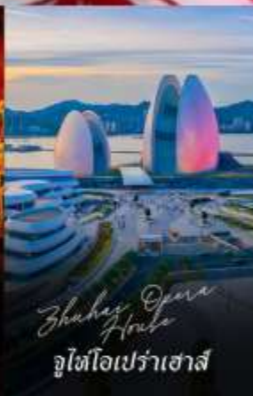
Zhuhai Opera House จูไห่โอเปราเฮาส์