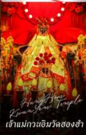
Hong Kong Kwamei Temple เจ้าแม่กวนอิมวัดสองฮา