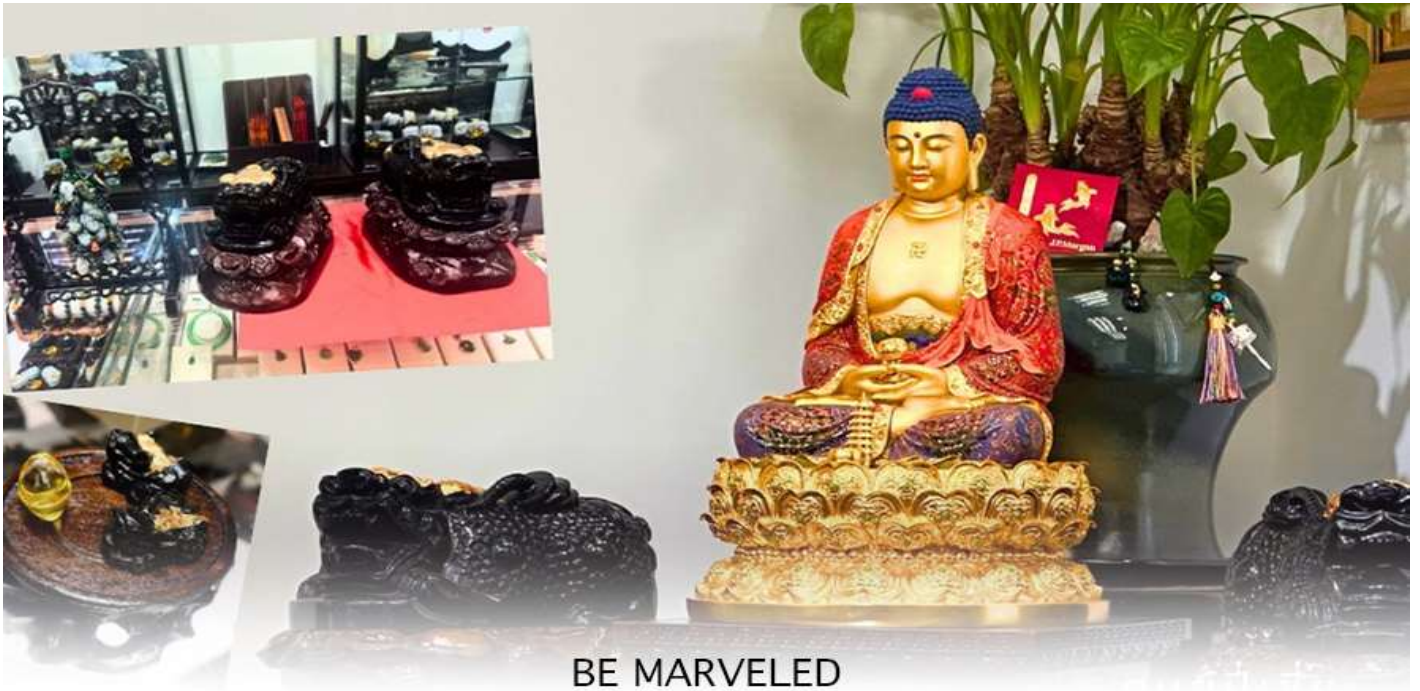
BE MARVELED ศูนยี่ปี่เซี่ยะ

และนำท่าน ชม ศูนยี่ปี่เซี่ยะ ซึ่งคนจีนนั้น ถือว่าหยกเป็นหิน ที่เป็นตัวแทนของความสวยงามและความบริสุทธิ์มีความเชื่อว่า หยก มงคล ถ้าพกติดตัวไว้จะอายุยืนและสุขภาพดีมีสินค้าน่ามากมายเกี่ยวกับหยก อาทิ กำไลหยก หรือสัตว์นำโชคอย่างปี่เซี่ยะ ให้ ท่านได้เลือกซื้อเป็นของฝาก, ของที่ระลึก หรือของนำโชคแต่ตัวท่านเอง