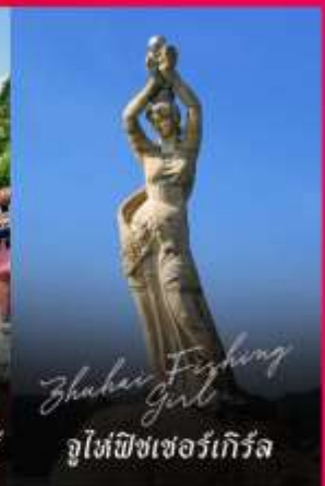
Zhuhai Fighting Girl จูไห่พิชเชอร์เกิร์ล