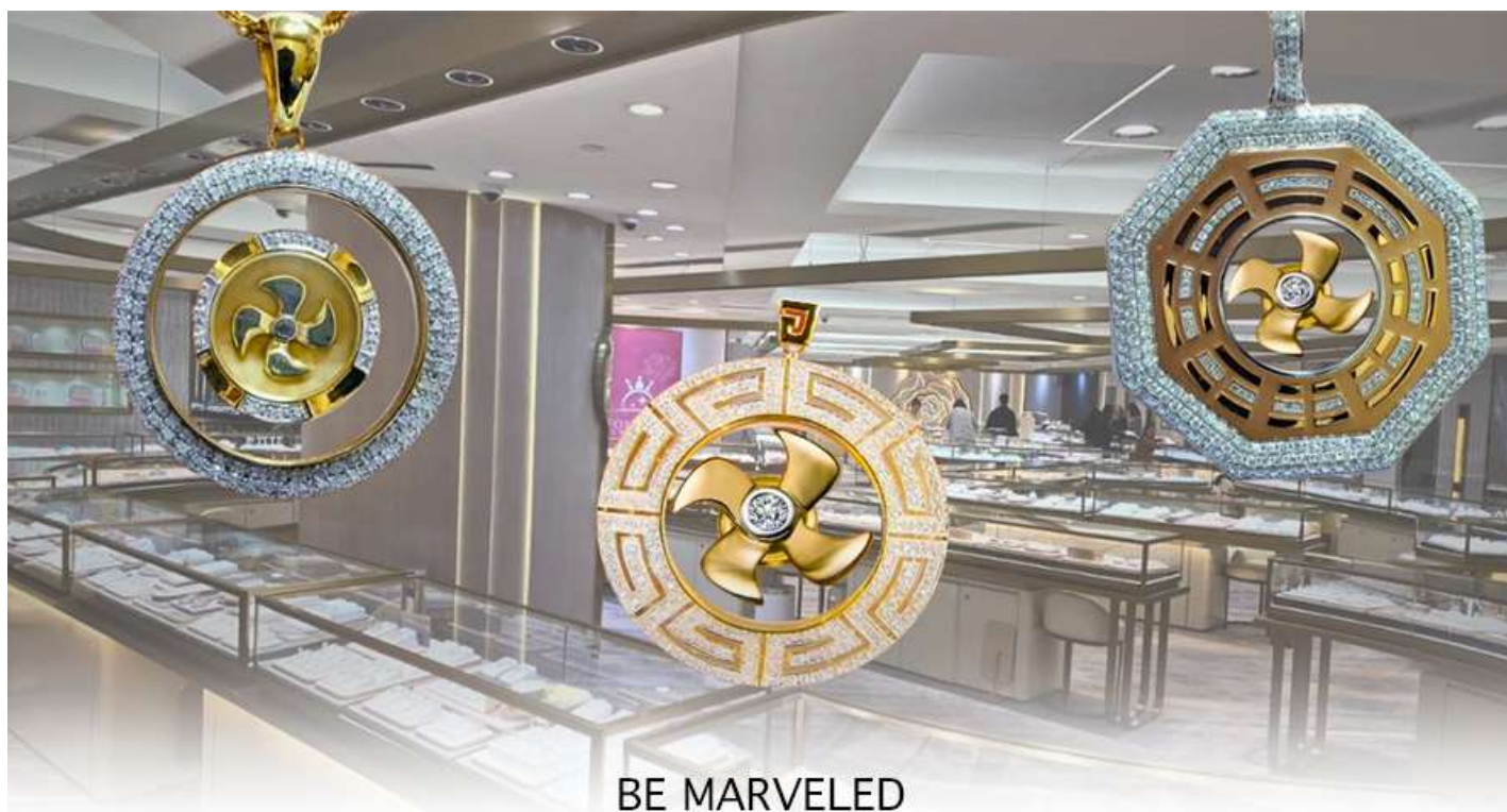
BE MARVELED ศูนย์ฮวงจุ้ย กังหันเศรษฐี

นำท่านชม ศูนย์ฮวงจุ้ย กังหันเศรษฐี ที่ขึ้นชื่อของฮ่องกง ท่านจะได้พบกับงานดีไซน์ที่ได้รับรางวัลยอดเยี่ยม และใช้ในการเสริมดวงเรื่องฮวงจุ้ย โดยการย่อใบพัดของกังหันที่เป็นสัญลักษณ์ของวัตต์แดงงหมิว มาทำเป็นเครื่องประดับ ไม่ว่าจะเป็นจี้, แหวน, กำไล หรือต่างหูเพื่อเป็นเครื่องประดับติดตัว และเสริมดวงชะตา ซึ่งสินค้าทุกชิ้นนี้ มีเอกสาร รับประกันคุณภาพเปลี่ยนหรือ ซ่อม ได้ตลอดอายุการใช้งาน หากเกิดการชำรุดจากสินค้าไม่ใช่อุบัติเหตุ