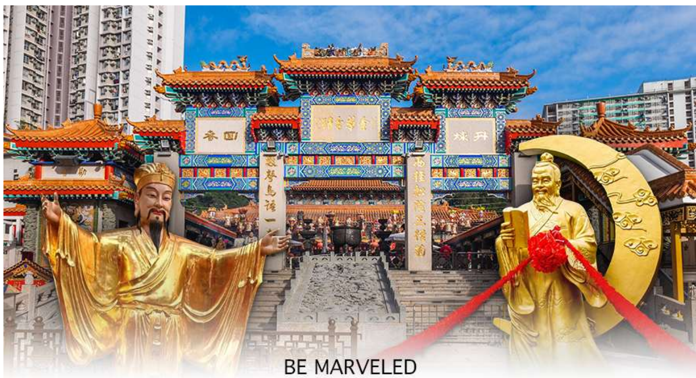
BE MARVELED วัดหวังต้าเซียน

จะพบรูปปั้นเจ้าบ่าว อยู่ทางขวา และรูปปั้นเจ้าสาวอยู่ทางซ้าย โดยมีด้ายแดงผูกโยงจากเจ้าบ่าวและเจ้าสาวมาที่เทพหยุกโหลว ซึ่งท่านจะคอยทำหน้าที่จกราชชื่อคู่รัก เชื่อกันว่าสมมุติที่ผู้เฒ่าถือในมือ คือบัญชีรายชื่อคู่รักที่จะได้รับคำอวยพรให้อยู่คู่กันอย่างร่มเย็นเป็นสุข ซึ่งจะปรากฏตัวยามค่ำคืนภายใต้แสงจันทร์ เป็นเทพเจ้าผู้เป็นอมตะที่อาศัยอยู่บนดวงจันทร์ และลงมาโลกมนุษย์ เพื่อผูกด้ายดวงชะตา ระหว่างคู่รักซึ่งเมื่อคู่กันแล้วก็จะไม่แคล้วคลาดกัน และมีความรักที่มั่นคงและยืนยาว