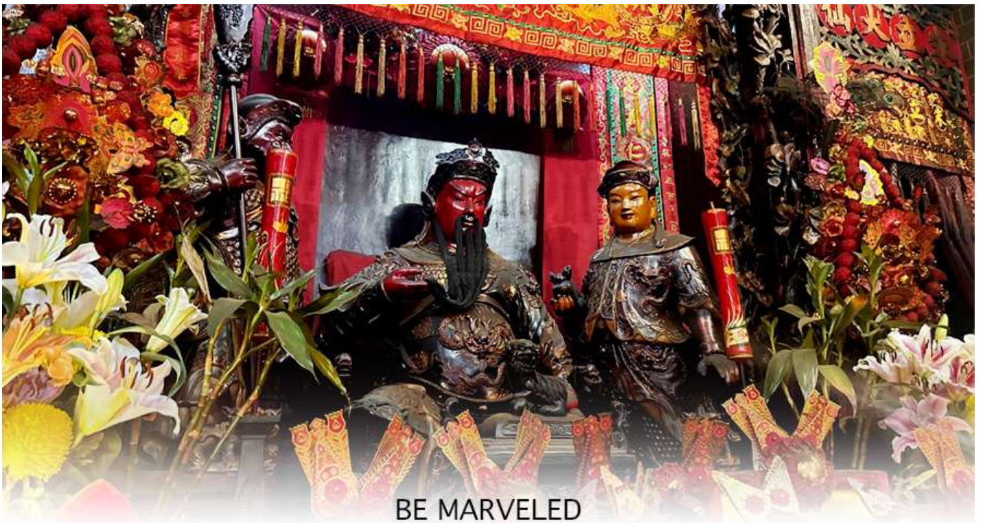
BE MARVELED วัดกวนอู

เจ้าแม่ทับทิม หรือ เทพธิดาแห่งท้องทะเล ซึ่งทำหน้าที่ปกป้องคุ้มครองชาวประมง ตั้งโดดเด่นอยู่ท่ามกลางสวนสวยที่ทอดยาวลงสู่ชายหาดให้ท่านนมัสการขอ และนำท่านเดินข้าม สะพานต่ออายุ ซึ่งเชื่อกันว่าข้ามหนึ่งครั้งจะมีอายุเพิ่มขึ้น 3 ถ้าข้ามแล้วห้ามเดินย้อนกลับไปเด็ดขาด เพราะคนฮ่องกงเชื่อว่าชีวิตจะสั้นลงไป 3 ปี สำหรับคนโสดจะนิยมขอพรกับ เทพเจ้าแห่งความรัก ให้เอามือลูบที่บริเวณหินสีดำ พร้อมกับอธิษฐานให้สมหวังกับความรัก ปิดท้ายด้วยการรับพลังฮวงจุ้ยจาก ศาลา แปรทิศ ซึ่งถือเป็นจุดรวมรับพลัง ถือเป็นจุดที่มีฮวงจุ้ยดีที่สุดในเกาะฮ่องกง และยังมีรูปปั้นองค์เทพอีกมากมายภายในวัดแห่งนี้ให้กราบไหว้ขอพร