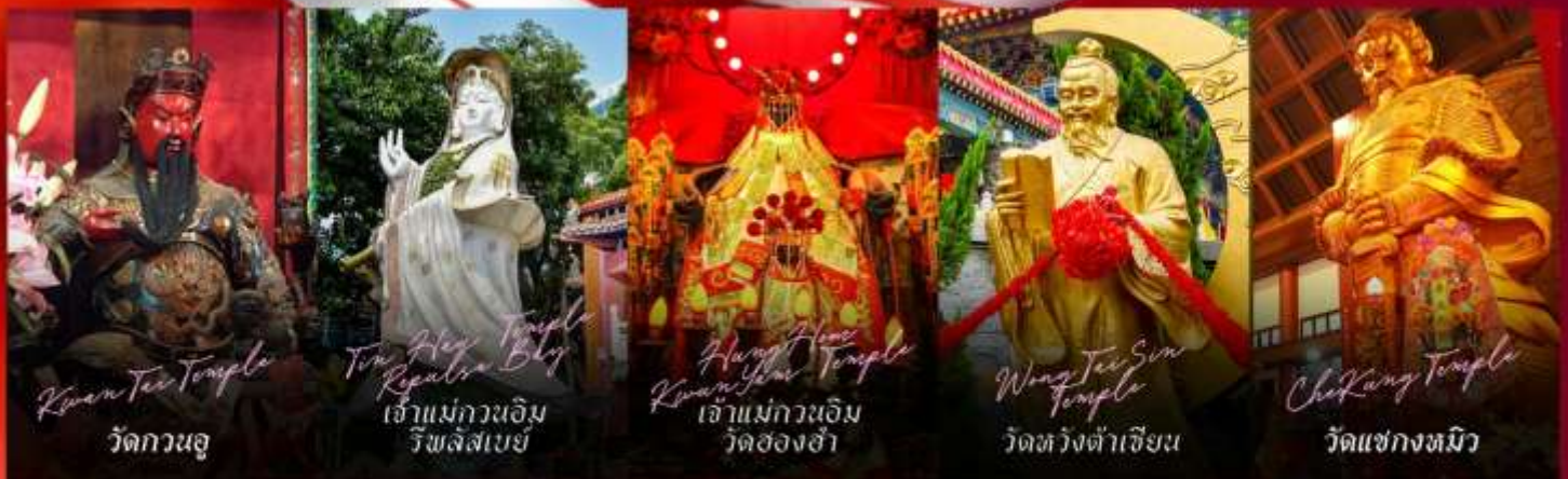
Kwan Tai Temple วัดกวนอู

รายการทัวร์ข้างต้นอาจมีการปรับเปลี่ยนเพื่อความเหมาะสม