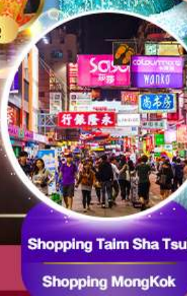
Shopping Taim Sha Tsui