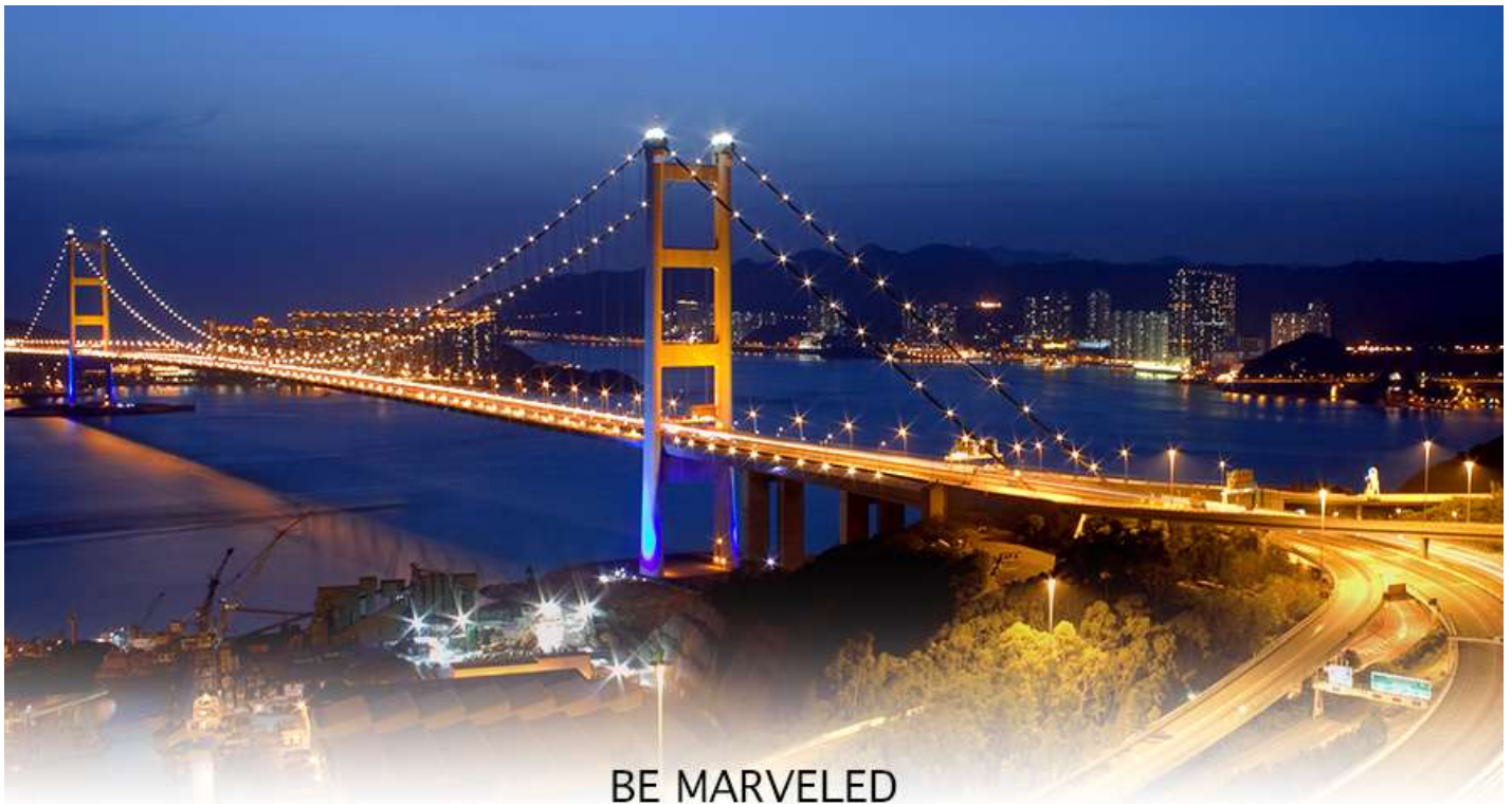
BE MARVELED สะพานแขวนฉิวหม่า