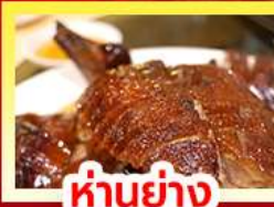
ห่านย่าง