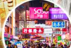
Shopping Taim Sha Tsui