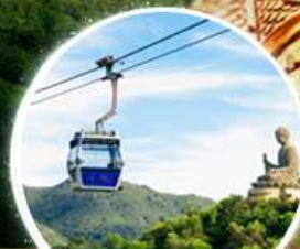
รวมกระเช้าฮ่องกง