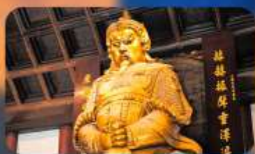
วัดเซ่งกงหมิว