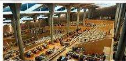
ห้องสมุดอเล็กซานเดรีย