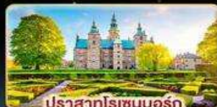
ปราสาทโรเซนบอร์ก