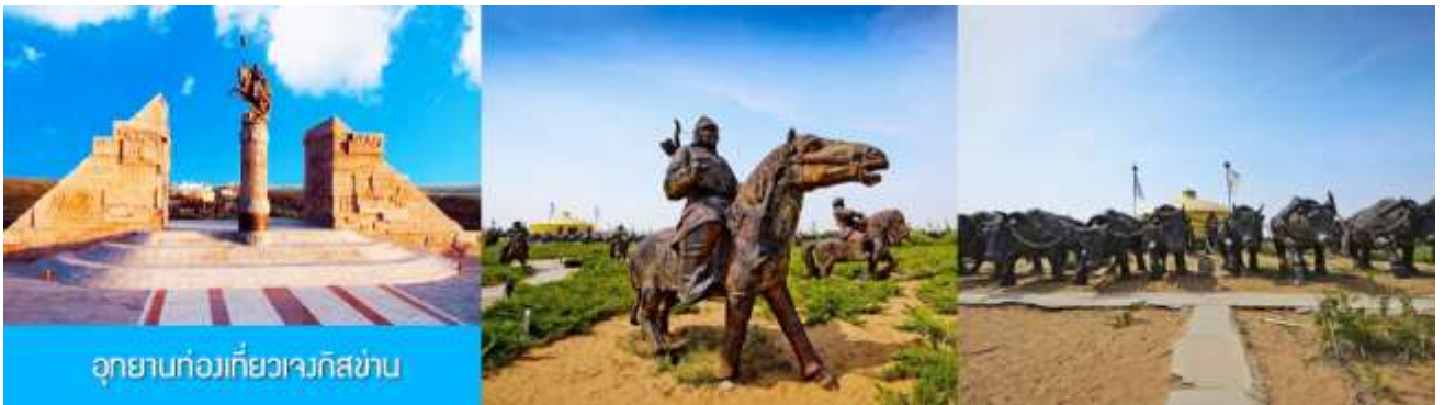
อุทยานท่องเที่ยวเวงกิสข่าน