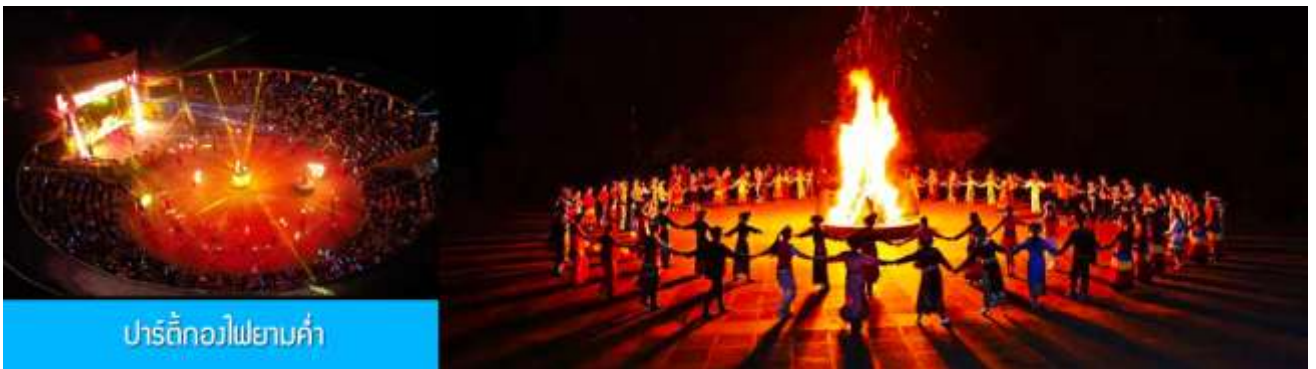
ปาร์ตี้กองไฟยามค่ำ