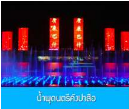
น้ำพุดนตรีคังปาสือ