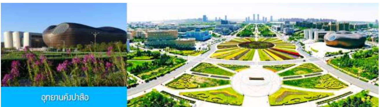
อุทยานคังปาสื่อ