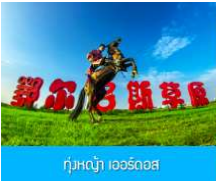
ทุ่งหญ้า เออร์ดอส

พักที่ ORDOS BOYU AIRUI HOTEL โรงแรมระดับ 4 ดาวท้องถิ่น หรือเทียบเท่าในเมืองเออร์ดอส