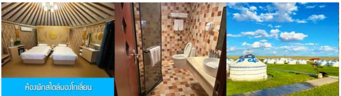
ห้องพักสไตล์มองโกลเลียน