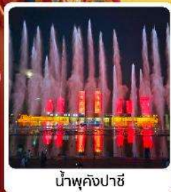
น้ำพุคังปาซี

● ไอลท์ เป็นสายการบินแห่งชาติของจีน ระดับ 5A ของจีน ภูเขาไฟอูลันฮาตา น้ำพุคังปาซี น้ำพุที่สูงที่สุดในเอเชีย