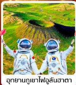
อุทยานภูเขาไฟอูลันฮาตา