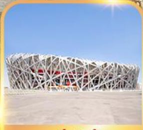
สนามกีฬารังนก