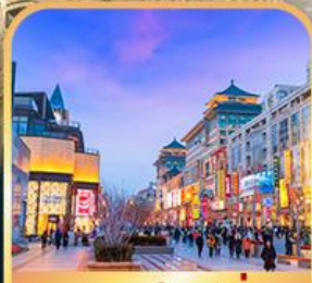
ถนนหวงฟู่จิ่ง