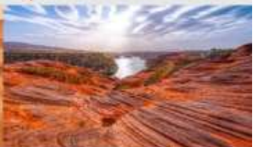
อุทยานหุบเขาคีลิน

*ทางบริษัทฯ ขอสงวนสิทธิ์ในการสลับโปรแกรมทัวร์ตามความเหมาะสมขึ้นอยู่กับสถานการณ์ทำงาน โดยค่าใช้จ่ายผลประโยชน์ของลูกค้าเป็นสำคัญ