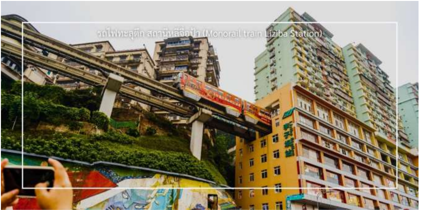
รถไฟเหาะลัดกิ๊วก สถานีลิซิป้า (Monorail train Liziba Station)

จากนั้นเดินทางไปยัง ตลาดหงหยาดัง (Hongyadong) หรือที่เรียกว่า "Hongya Cave" เป็นสถานที่ท่องเที่ยวที่มีชื่อเสียงในเมืองฉงชิ่ง โดยตั้งอยู่ริมแม่น้ำแยงซี มีบรรยากาศที่เต็มไปด้วยวัฒนธรรมและประวัติศาสตร์ ตลาดหงหยาดังเป็นพื้นที่ที่มีอาคารแบบดั้งเดิมที่สร้างขึ้นในสไตล์สถาปัตยกรรมแบบซิโน-ทิเบต โดยมีร้านค้า ร้านอาหาร และบาร์จำนวนมาก ที่นี่ท่านสามารถลิ้มลองอาหารรสเด็ดและชมพื้นเมืองอื่นๆที่ขึ้นชื่อ ตลาดหงหยาดังยังมีวิวทิวทัศน์ที่สวยงามสามารถเดินเล่นตามทางเดินที่มีการจัดแสดงงานศิลปะและสินค้าท้องถิ่น