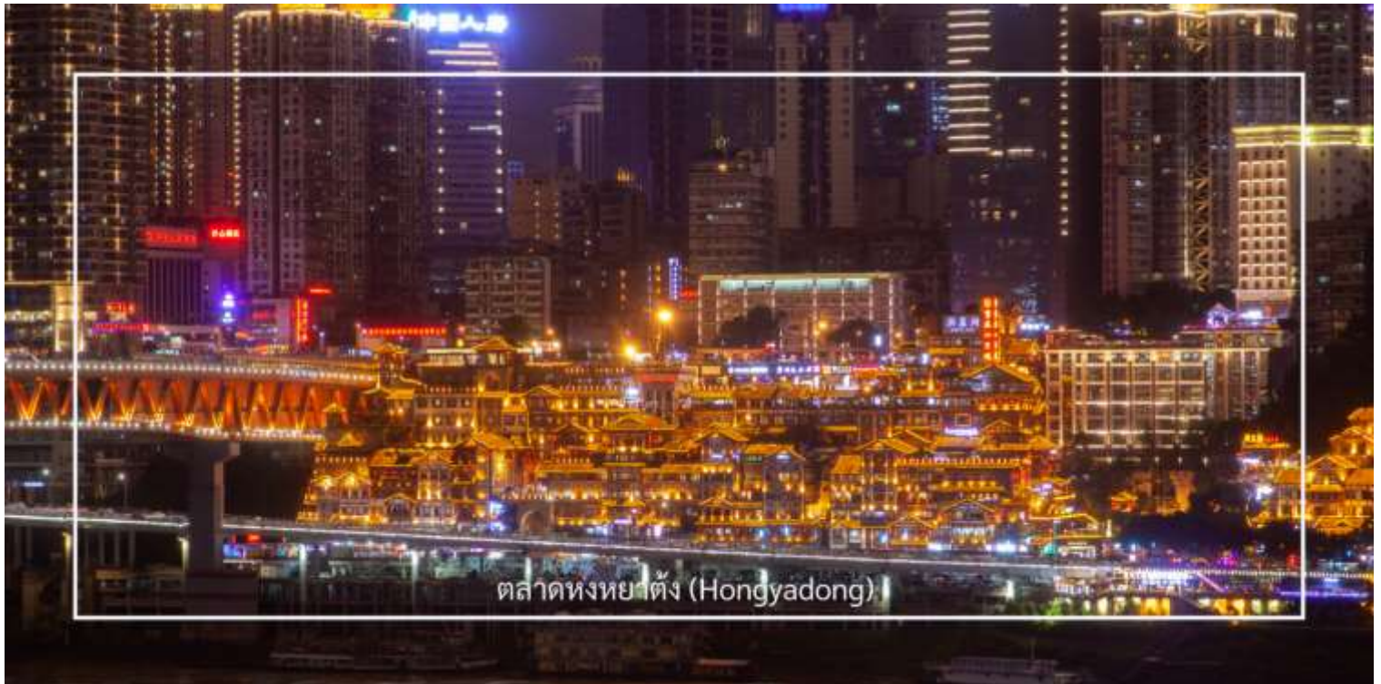
ตลาดหงหยาดัง (Hongyadong)

จากนั้นเดินทางไปยัง ตลาดหงหยาดัง (Hongyadong) หรือที่เรียกว่า "Hongya Cave" เป็นสถานที่ท่องเที่ยวที่มีชื่อเสียงในเมืองฉงชิ่ง โดยตั้งอยู่ริมแม่น้ำแยงซี มีบรรยากาศที่เต็มไปด้วยวัฒนธรรมและประวัติศาสตร์ ตลาดหงหยาดังเป็นพื้นที่ที่มีอาคารแบบดั้งเดิมที่สร้างขึ้นในสไตล์สถาปัตยกรรมแบบซิโน-ทิเบต โดยมีร้านค้า ร้านอาหาร และบาร์จำนวนมาก ที่นี่ท่านสามารถลิ้มลองอาหารรสเด็ดและชมพื้นเมืองอื่นๆที่ขึ้นชื่อ ตลาดหงหยาดังยังมีวิวทิวทัศน์ที่สวยงามสามารถเดินเล่นตามทางเดินที่มีการจัดแสดงงานศิลปะและสินค้าท้องถิ่น