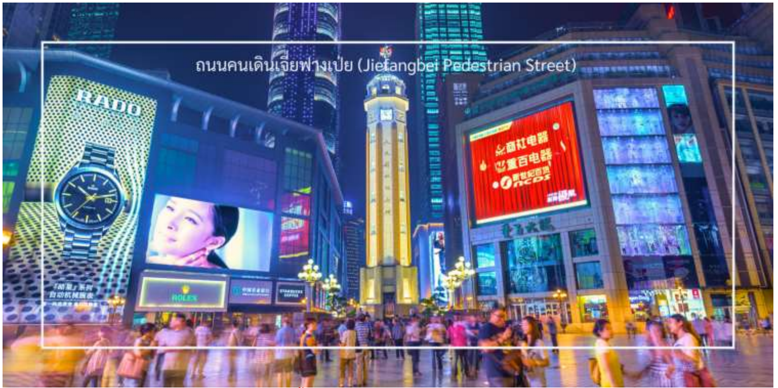
ถนนคนเดินเจียงเป่ย์ (Jiefangbei Pedestrian Street)

เย็น บริการอาหารเย็น ณ ภัตตาคาร (มื่อที่12) เมนูพิเศษ: เปิดปักษ์ ได้เวลาอันสมควร นำท่านเดินทางสู่สนามบินฉงชิ่ง เพื่อเดินทางกลับ