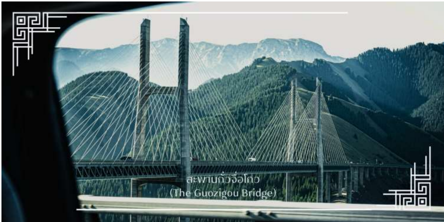
สะพานกัวจื่อโกว (The Guozigou Bridge)

จากนั้นนำท่านเดินทางสู่ ทุ่งดอกไม้เทียนซาน (ใช้เวลาเดินทางประมาณ 3 ชั่วโมง) โดยระหว่างทาง รถจะนำท่านผ่าน ชมความยิ่งใหญ่ของ สะพานกัวจื่อโกว(Guozigou Bridge) สะพานแขวนขนาดใหญ่ที่ทอดตัวข้ามหุบเขากัวจื่อโกวได้อย่างสง่างาม นับเป็นหนึ่งในผลงานวิศวกรรมที่โดดเด่นของจีนเจียง ด้วยโครงสร้างอันทันสมัยที่ผสมผสานเข้ากับภูมิประเทศภูเขาสูง ทำให้ที่นี่เกิดเป็นภาพทิวทัศน์ที่น่าสนใจและสวยงามอย่างมาก