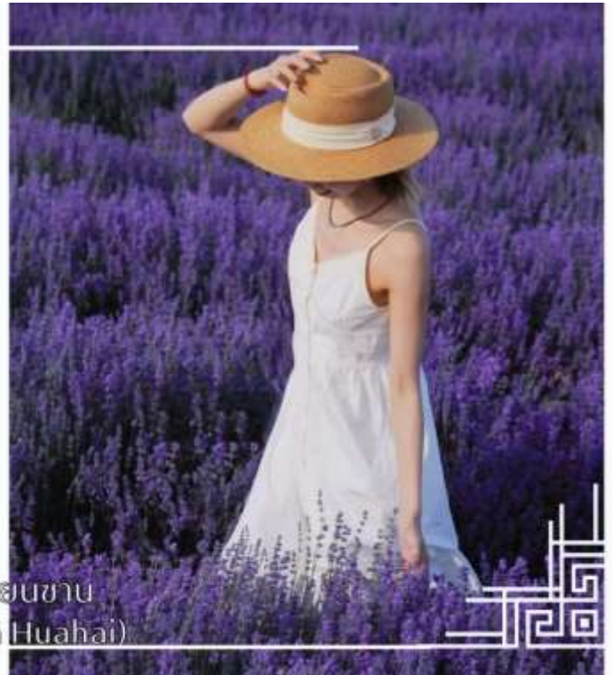
ทุ่งดอกไม้เทียนซาน (Yili Tianshan Huahai)

จากนั้นนำท่านสู่เมืองนาราตี (ใช้เวลาเดินทางประมาณ 3 ชั่วโมง)