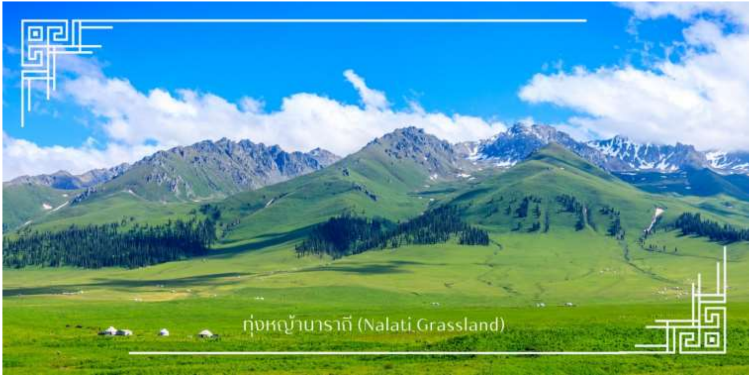
ทุ่งหญ้านาลาตี (Nalati Grassland)