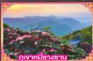
ภูเขาที่มีชาวซาน