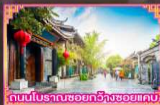
ถนนโบราณซอยกว้างซอยแคบ

เมนูพิเศษ! สับรสหมูไฟสວນຕົ້ນຕໍາຣັບສໄຕສ໌ຍົນຮວນໄພ