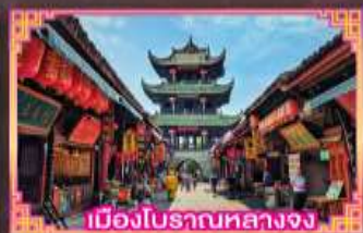
เมืองโบราณหลวงจง