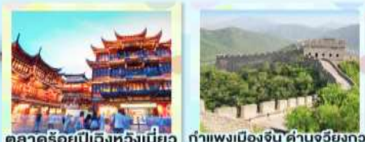
ตลาดร้อยปีเฉิงหวงเมี่ยว กำแพงเมืองจีน ด้านจียังทงวน