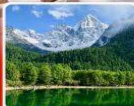
อุทยานπίงฝิงโกว