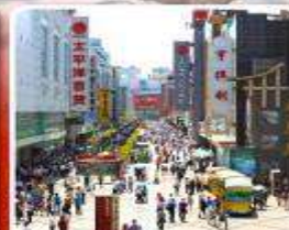
ช้อปปิ้งถนนคนเดินชุนซีลู่