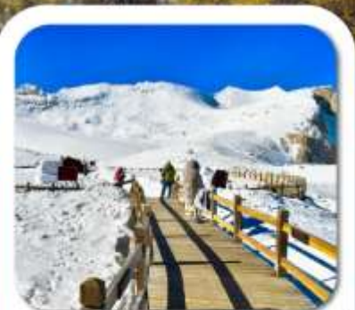
"ต้ากู่กลาเซียร์"

เที่ยวชมความงาม 3 อุทยานชื่อดัง : สี่ดรุณี • ป่าเผิงโกว ต้ากู่กลาเซียร์ ชมความน่ารักของหมีแพนด้า • จัตุรัสหยางเทียนวู่ ชอยกว้างชอยแคม • ถนนคนเดินซุนซีลู่ • POP MART