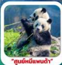
"ศูนย์หมีแพนด้า"