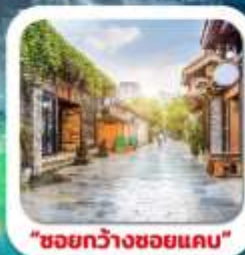
"ชอยกว้างชอยแคม"