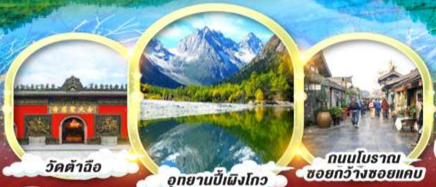
วัดคำอ้อ