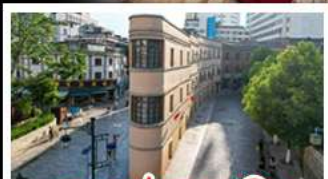
ถนนเก่าคุนหมิง