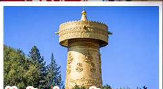
วัดต้าฝอ กงล้อมนตรา