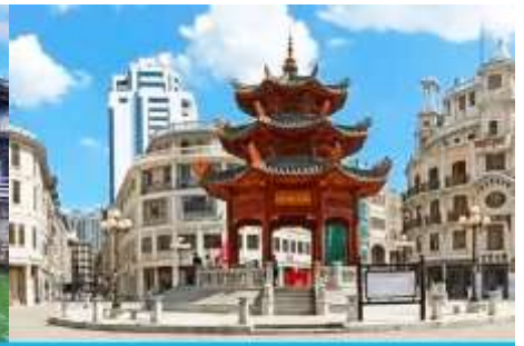
ย่านเมืองเก่าซัวเถา