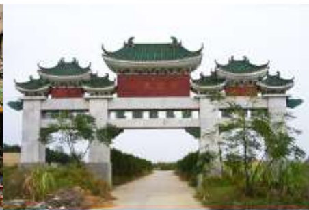
สุสานพระเจ้าตากสิน