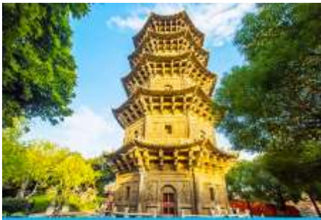
วัดโคหยวน