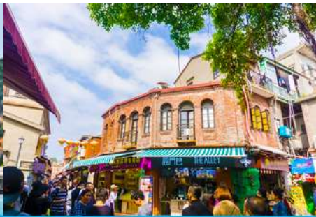
ถนนคนเดินหัวมังกร