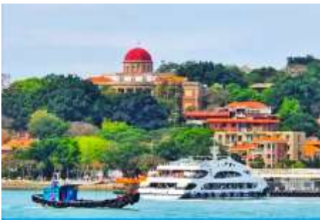
เกาะกู่ลิ่งหยวี

พักที่ โรงแรม XIAMEN HENGLONG HOTEL 4* หรือเทียบเท่าในเซี่ยะเหมิน