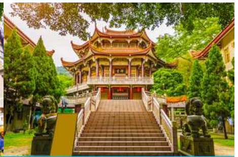
วัดหนานกัวซื่อ