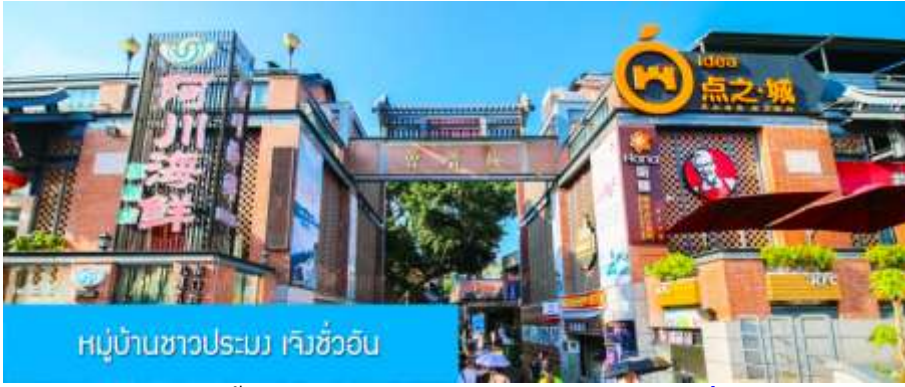
หมู่บ้านชาวประมง เจิงชว้ออัน