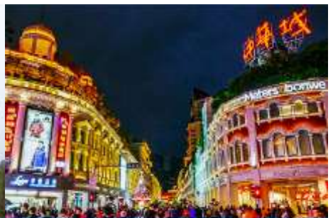
ถนนคนเดิน จวซาลู่