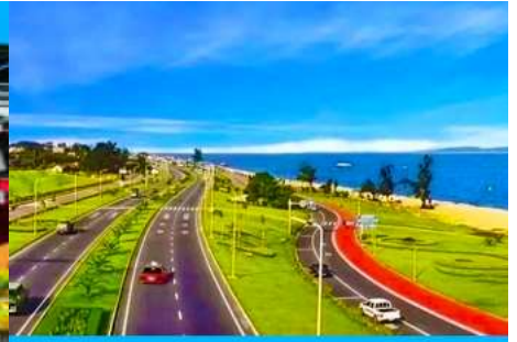
ถนนหวนเต่าลู่