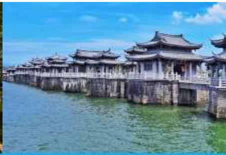
สะพานเซียงจื่อเจียว