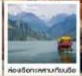
เบิ่ฮายไฮเตียน