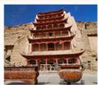
ท่าม่อเถา