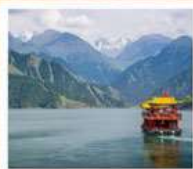
ช่องเรือทะเลสาบเทียนฉือ