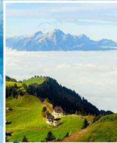
RIGI KULM Queen of the Mountains