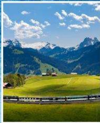
GOLDEN PASS LINE Montreux-Zweisimmen