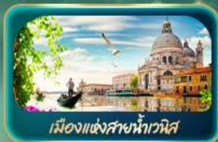
เมืองแห่งสายน้ำเวนิส

จุดบรรจบความอลังการของธรรมชาติ Dolomites และ ทะเลสาบมิซูรีนำ ชมน้ำสีเทอร์ควอยซ์ ทะเลสาบเบริส สูดโรแมนติกเมืองแห่งสายน้ำเวนิส ห้ามพลาด มหาวิหารดูโอโมแห่งมิลาน โรมัน ฮาร์น่า บ้านของจูเลียต เที่ยวลูเซิร์น ชมสิงโตหินแกะสลัก เดินเล่นสะพานไม้อาเปลา อินส์บรุค ย้อนอดีตกับเสาชอนด์แอนน์ หลังคาทองคำ ซ้อปจ๊อย Outlet