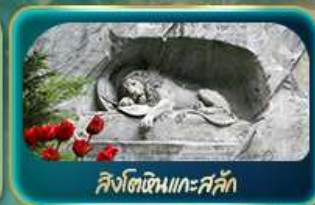
สิงโตหินแกะสลัก