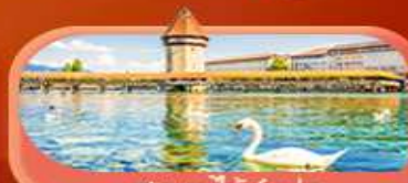
สะพานไมซ์าปก

Highlight เมีอนหมู่บ้านแสนสวยเซอร์แมท เช็กอินศาลาไทยสุดงามที่โลซาน เที่ยวลูเซิร์น ชมสะพานไมซ์าปกและอนุสาวรีย์สิงโต ซาลี แพลสซึน ชมประติมากรรม The Fork และปราสาทซิลลองริมทะเลสาบ เยือนมิลาน มหาวิหารดูโอโม เที่ยวเวนิส เมืองลอยน้ำสุดโรแมนติก อินกับรักอมตะที่บ้านจูเลียต และช้อปปิ้งจุใจที่ Serravalle Outlet