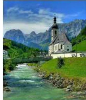
ออสเตรียบาวาเรียดินแดนแห่งเทพนิยาย

ออสเตรีย – บาวาเรีย (Austria-Bavaria) ดินแดนวัฒนธรรมเก่าแก่ที่ครอบคลุมสองประเทศและแทบแยกกันไม่ออกเลยว่าเราเที่ยวอยู่ในออสเตรียหรือเยอรมัน ท่านจะประทับใจไปกับหมู่บ้านเล็กๆน่ารัก ที่ตั้งอยู่บริเวณริมทะเลสาบในเทือกเขา “เยอรมัน-ออสเตรียแอลป์” พร้อมบริการอาหารรสเลิศและที่พักอย่างดีระดับ 4 ดาว หลูหรูที่เราคัดสรรมาให้ท่านได้พักผ่อนอย่างเต็มที่ให้การเดินทางของท่านคุ้มค่าที่สุดที่สุดในเส้นทางที่สวยงามที่สุดของออสเตรีย-บาวาเรีย