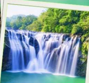
น้ำตกซือเฟิ่น